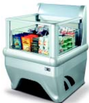
ACTION 70 Titan Silver