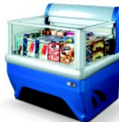
ACTION 100 Blu Techno