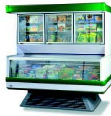
AKRON GLASS Colours