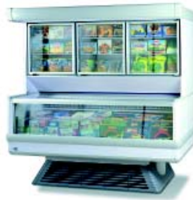
AKRON GLASS Standard

Comby display case plug in at static TB (base) and ventilated TB (upper part) refrigeration for ice-cream and frozen foods.