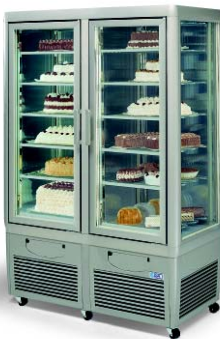
CRISTAL PALACE 700 TB-TB