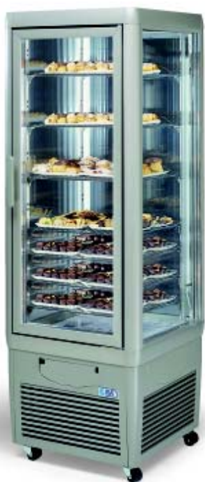
CRISTAL PALACE 350 CH