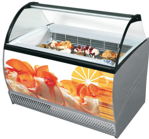
ISABELLA LX 10