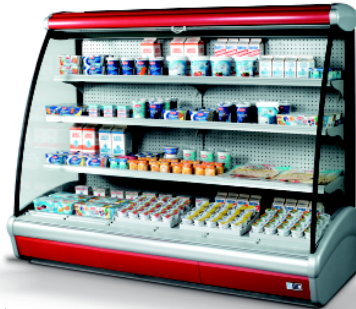
MASK 190 Rosso Colorado

Wall site display case, at ventilated refrigeration, remote control unit, for displaying of dairy products and fresh pre-packed products.