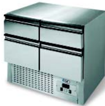
SE 2C 2/3