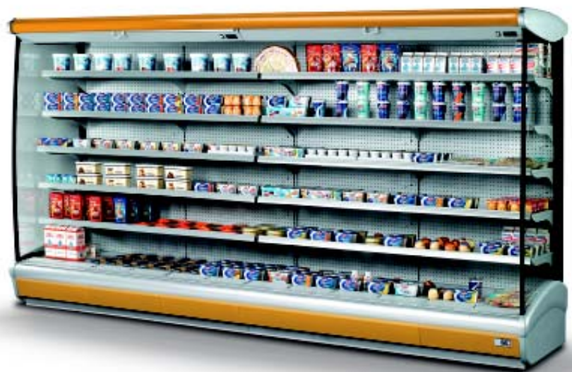
SPEED 375 Gold Yellow